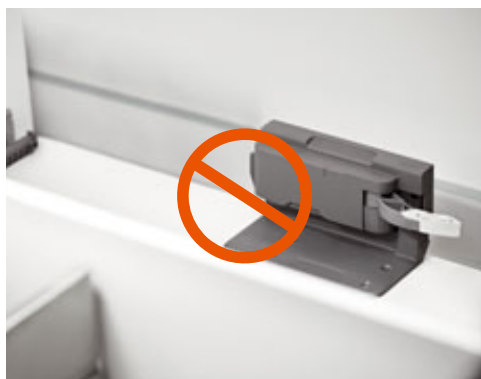
SERVO-DRIVE, электрическая система открывания